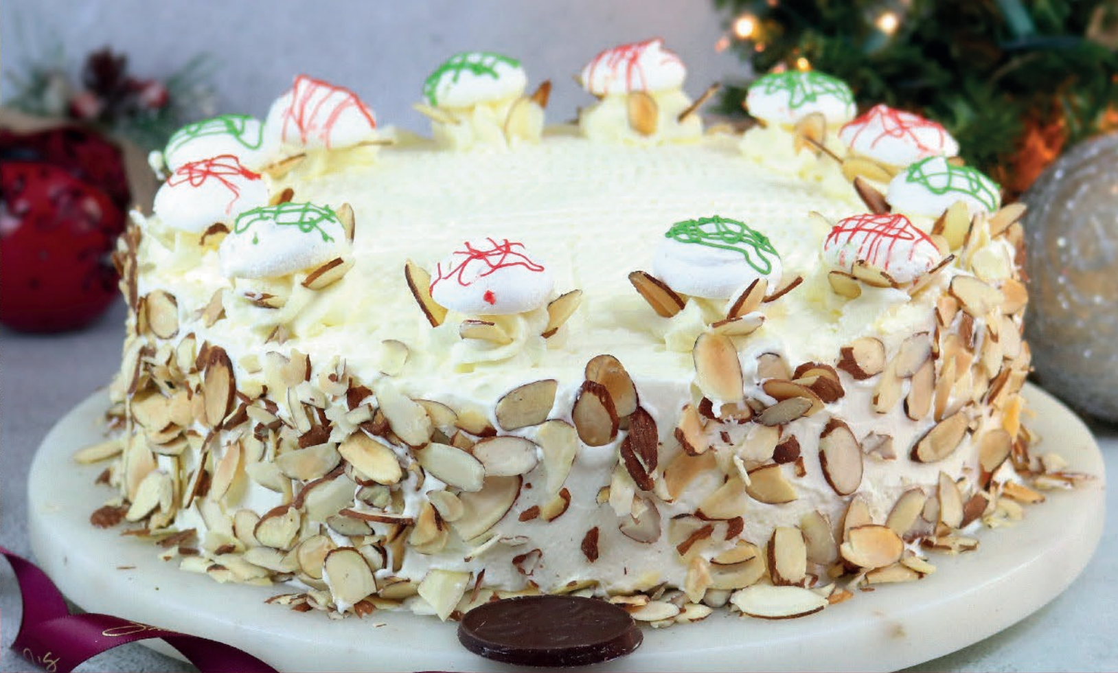
Tarta de Almendras

Torta blanca, merengue y crema de almendras. Decorada con lascas de almendras.